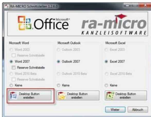
Abbildung 3 - ra-micro Office Schnittstellen einrichten