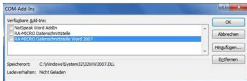
Abbildung 2 - COM-Add-Ins anzeigen