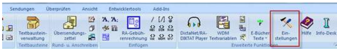
Abbildung 4 - ra-micro Office Schnittstellen einrichten

Bitte deaktivieren Sie dort den Eintrag „Schnittstelle ohne ra-micro Hauptmenü starten“.