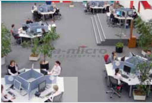
RA-MICRO Support-Zentrale Berlin, eines unserer 4 Support-Center

So können Sie den RA-MICRO Anwendersupport erreichen: